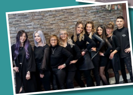
Friseursalon Kopfkultur, Gießen, bietet Teilzeitausbildung seit 2014 an.